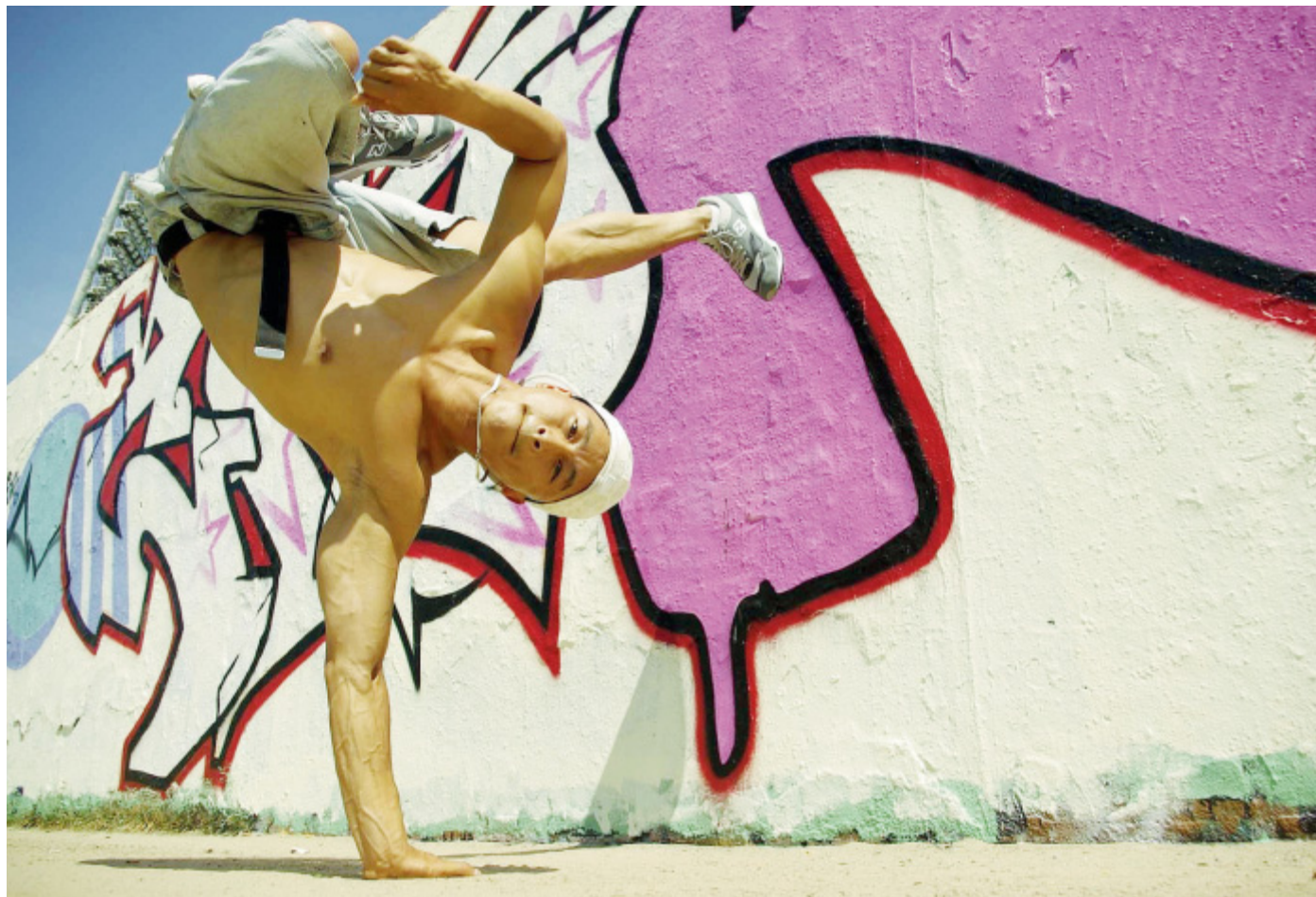
Das Lebensgefühl junger Großstädter: Das setzten die sieben Tänzer und Akrobaten der Formation VibeZ in Bewegung um, die aus Berlin nach Detmold kommt.

Aus Berlin kommen VibeZ nach Detmold. Sieben Tänzer und Akrobaten tanzen das Lebensgefühl junger Großstädter. Streetdance, Akrobatik, Beatboxing, Musik live gemixt und gespielt sind Element der