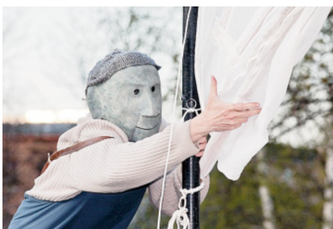
Poetisches Maskentheater im öffentlichen Raum: Dafür steht die deutsch-französische Compagnie Theatre Fragile.

teren Menschen nähert sich Theatre Fragile dem Thema. Was die Interviews angeht, er-